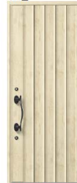
エクリュアイボリー 設定色: ⑧⑨⑩⑪