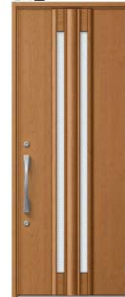
クリエラスク 設定色: ⑫⑬⑭⑮⑯