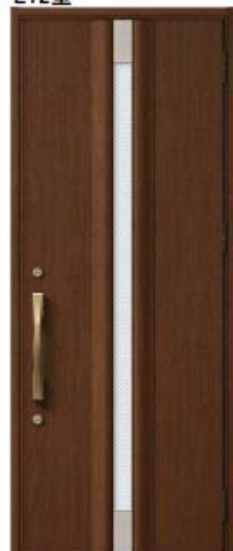
ポートマホガニー 設定色: ⑫⑬⑭⑮⑯