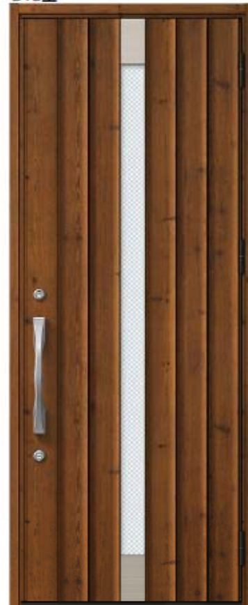
アイリッシュパイン 設定色: ①②③④⑤ ⑧⑨⑩⑪⑫⑬