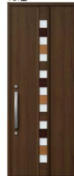
クリエモカ 設定色: ②⑫⑬