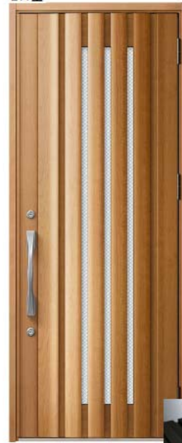
クリエラスク 設定色 ⑫⑬⑭