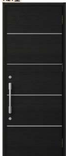
トリノパイン 設定色: ①③④