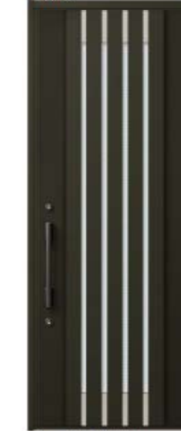
オータムブラウン 設定色: ①②③④⑤ ⑥⑦⑫⑬⑭⑮⑯